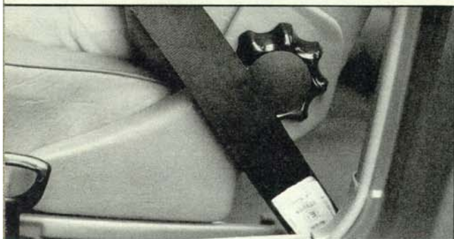
Ärgerlich: Gurtband läuft über den Lehnenverstellknopf

noch genügsamer. Wer diesen Spareffekt durch Gaswegnehmen konsequent ausnützt, kann zusätzlich einen halben Liter abknapsen. Auf hügeligen Autobahnen – vor allem bei Tempobegrenzung – bringt die Schubabschaltung manchmal für längere Zeit Null-Verbrauch. Unterhalb 1200/min setzt die Kraftstoffzufuhr so sanft wieder ein, daß es nur ein aufmerksamer Fahrer spürt.