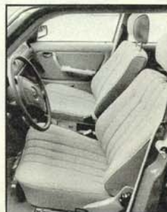
Sitzbezug ganz aus Stoff