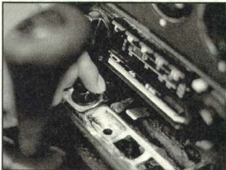
Unpraktisch: Ascher knapp vor dem Schalthebel

70er Reifen liefert Daimler-Benz für den 230 E nicht ab