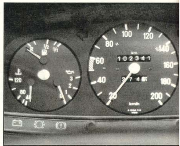
Rekordpensum: 100 000 Kilometer in einem Jahr und drei Tagen